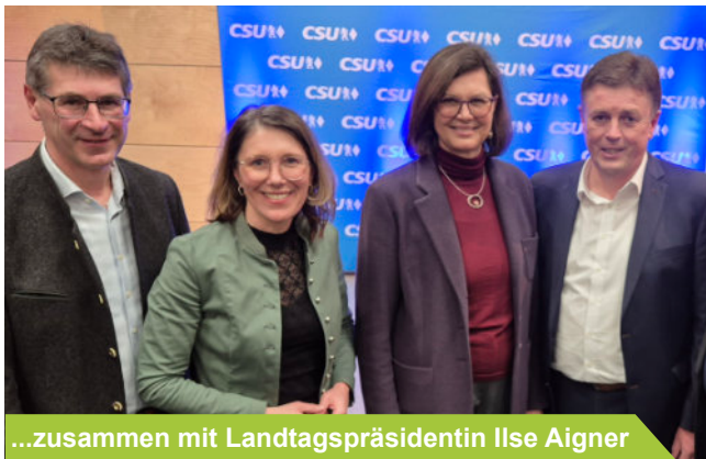
...zusammen mit Landtagspräsidentin Ilse Aigner

Mein Ziel als Ihre Bürgermeisterin ist es, unsere Stadt mit Weitblick weiterzuentwickeln, indem wir gemeinsam anpacken und Lösungen finden . Gerne möchte ich weiter Verantwortung für unsere Gemeinschaft übernehmen und setze mich mit voller Kraft dafür ein.